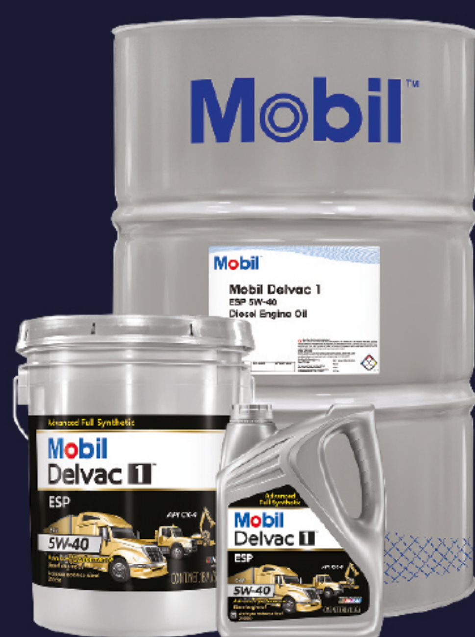
Mobil Delvac™ 1 ESP 5W40