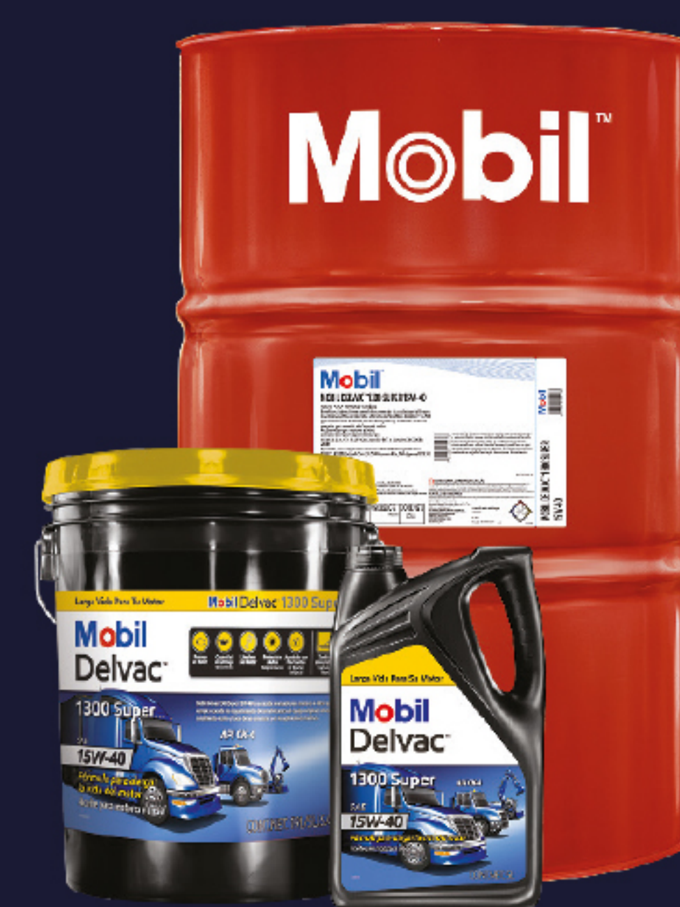
Mobil Delvac™ 1300 Super 15W40

Se ha demostrado que los lubricantes de motor Mobil Delvac™ ayudan a: