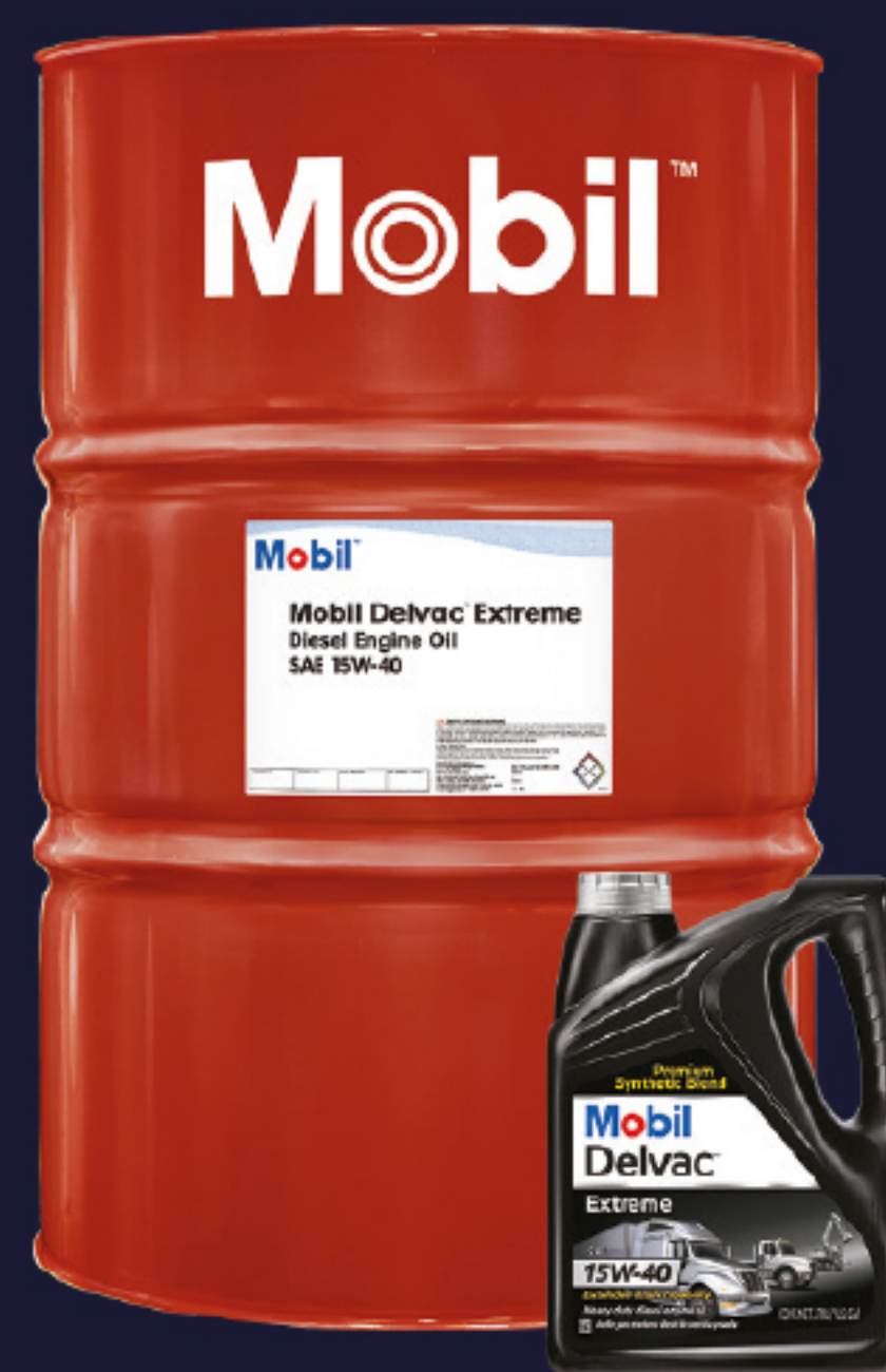
Mobil Delvac™ Extreme 15W40